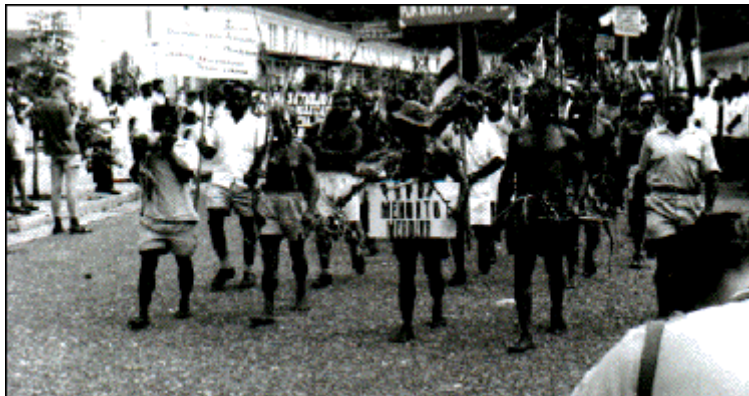
Pro-Nederlandse demonstratie in Hollandia 1962

Zo jong als ik was, kreeg ik natuurlijk een stuk van de heersende ideologie mee: wij waren goed bezig met Nieuw-Guinea en de papoea's, wij waren ze aan het helpen te ontwikkelen, zodat zij later op eigen benen zouden kunnen staan. De grote boze buitenwereld was tegen ons, terwijl we het zo goed bedoelden. Met vriendjes ging ik in Hollandia kijken naar een pro-Nederlandse demonstratie van papoea's. Op enige afstand voor de demonstratie liep een papoea met een rood overhemd en een witte broek. Omdat de Indonesische vlag rood-wit is, wisten wij knapen het meteen: opgewonden vertelden wij elkaar dat dat een pro-Indonesische vuilak was.