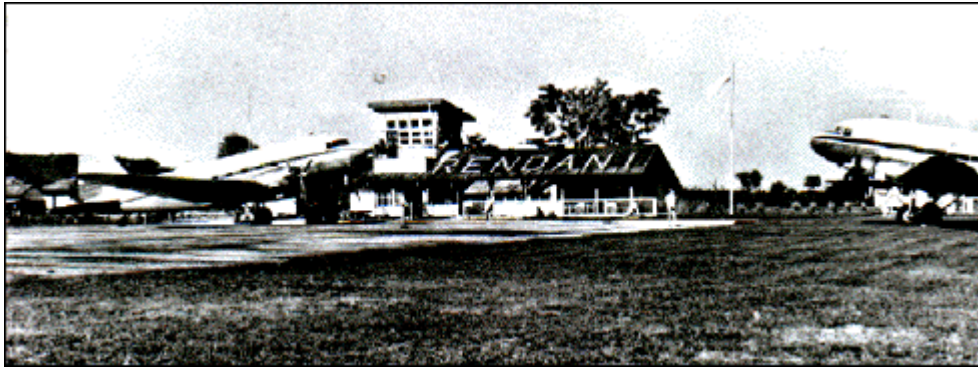
Vliegveld van Manokwari

West-Nieuw-Guinea was bij de soevereiniteitsoverdracht van Nederlands Indië aan Indonesië in 1949 Nederlands gebleven, al was het lange tijd onderdeel geweest van Nederlands Indië. Indonesië had haar aanspraken op het westelijk deel van Nieuw-Guinea echter nooit opgegeven. De kwestie bleef bij de soevereiniteitsoverdracht 'open'.