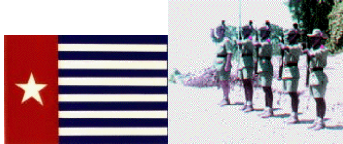
Een eigen vlag en het begin van een eigen leger: Papoea Vrijwilligerkorps

loop der jaren nam de dreiging van een grote invasie door Indonesië steeds meer toe.