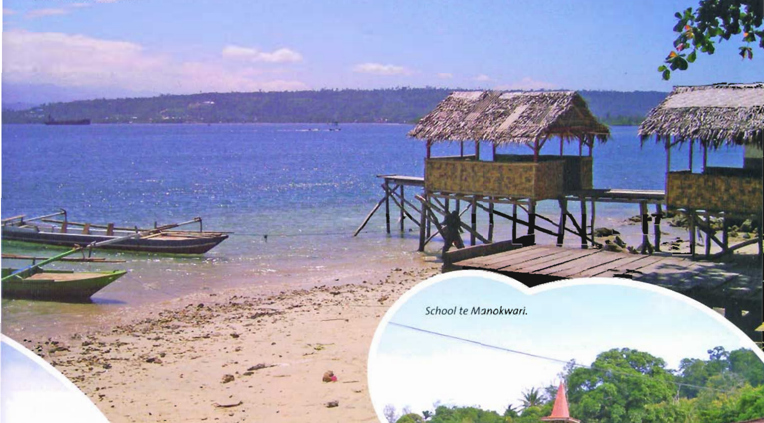
School te Manokwari.