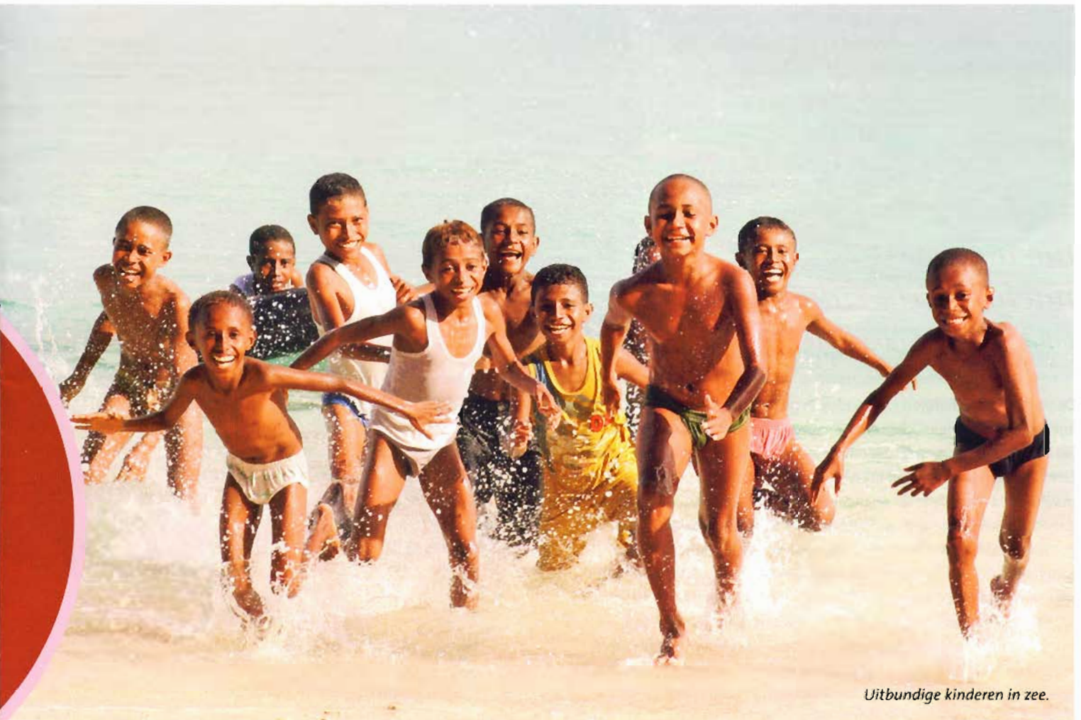
Uitbundige kinderen in zee.

Daar is Indonesië weer: de onlogische afhandelingen, de geur van kruidnagelsigaretten, de vochtige hitte, rappe gebaren met slanke handen, donkere ogen, mierzoete deo's, vriendelijkheid, strakke uniformen. Hoewel ik erg jong was bij mijn vertrek, zit dit land in mijn vezels. Veel tijd om dit alles tot me door te laten dringen is er echter niet, want ons