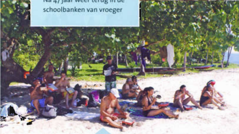
Zittend en lekker picknicken in de koelte van een overhangende boom op het witte zand van Mansinam. Het was alsof we nimmer waren weggeweest