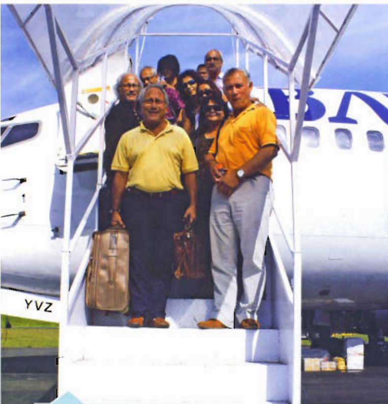
Aankomst in Manokwari