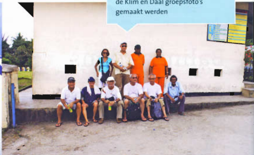
Groepsfoto op de plek waar vroeger de Klim en Daal groepstoto's gemaakt werden