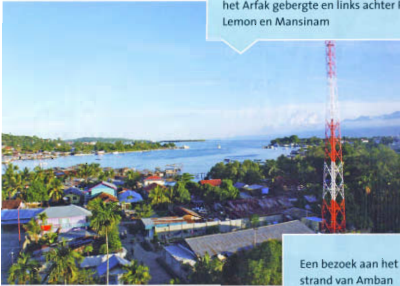
Een bezoek aan het strand van Amban waar eens de golven met een hels kabaal op het zwarte strand te pletter sloegen en je er vroeger opgevreten werd door de agats, een kleine venijnige zandluif.